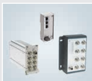
非管理型以太网交换机