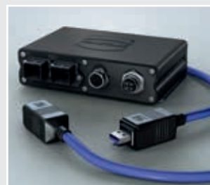
浩亨MICA®(模块化工业计算架构)