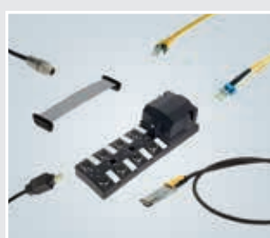
系统电缆、电缆线和配电箱

灵活，坚固耐用并且可自由调节。为您的工业网络、控制系统和自动化构建提供适合的接口。